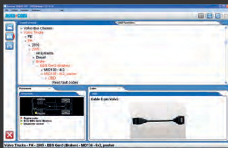
AUTOCOM TRUCKS software